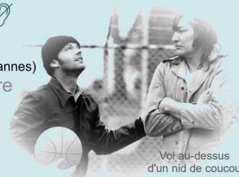
Vol au-dessus d'un nid de coucou

Chacun de nous a pour mission la protection et la défense des droits